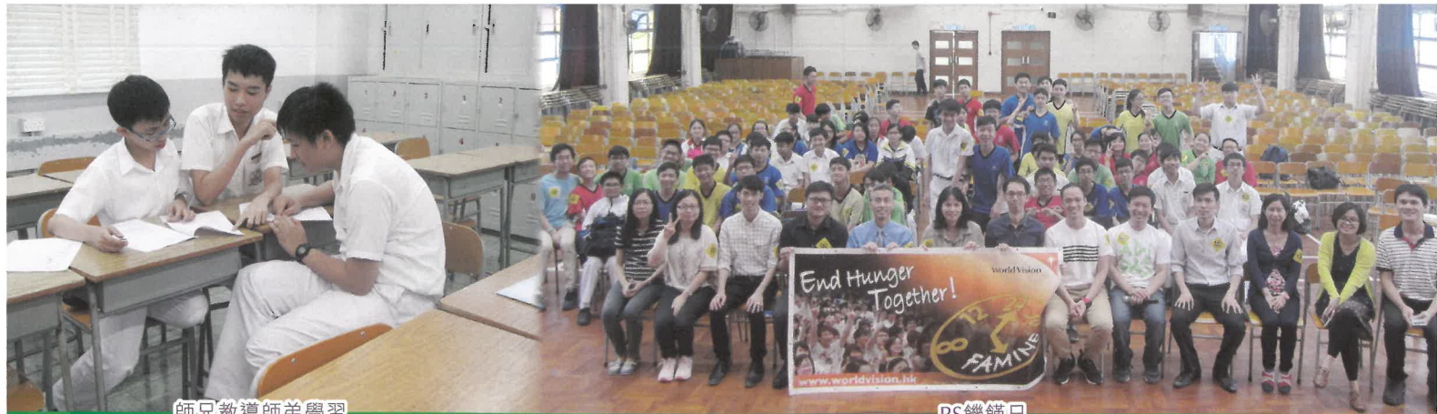
師兄教導師弟學習