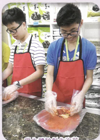
學生體驗製作泡菜