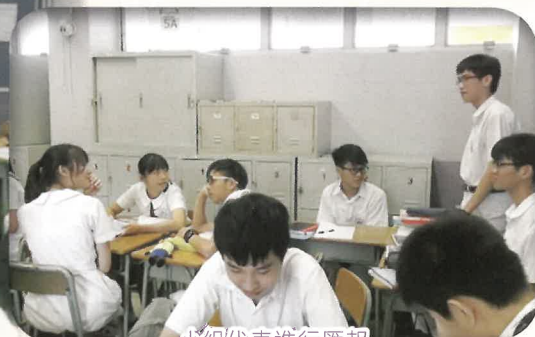
小組代表進行匯報