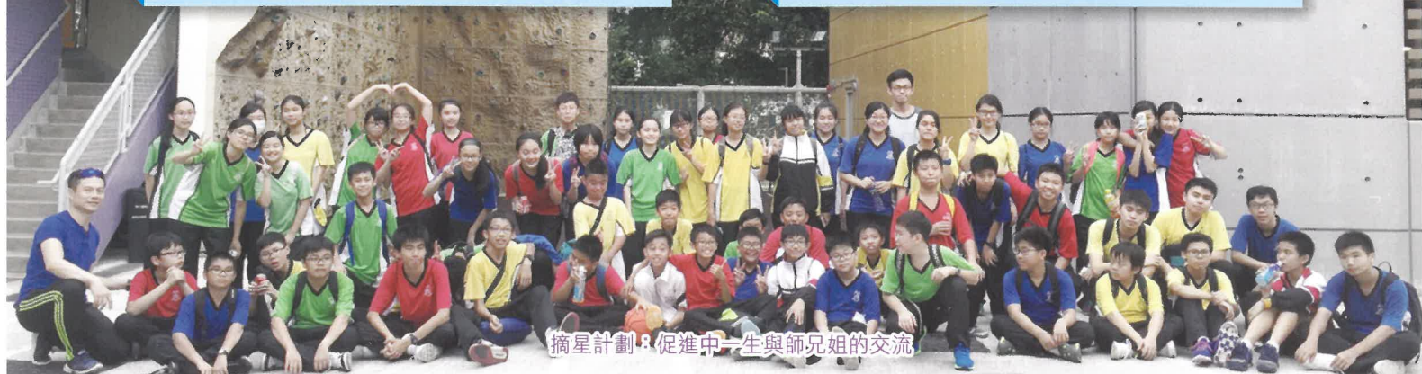
摘星計劃：促進中一生與師兄姐的交流