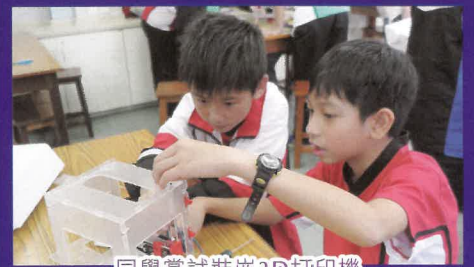
同學嘗試裝嵌3D打印機