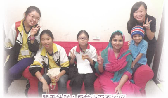
關愛社群：探訪南亞裔家庭

筆者就讀中學時期不善人際溝通，生活圈子狹窄，但中七畢業那年參加了義工訓練班，性格和人生觀起了很大的變化，為人變得積極樂觀，喜歡與人溝通，生活圈子也擴闊了不少。故在中學期間必須讓學生多參與社會服務，認識不同階層人士的需要，從而體會到施比受更為有福的道理。我校的學生就是因為曾參與紅十字會、公益少年團、探訪老人院等服務，畢業後成為醫護人員和社工，在這些行業中繼續承傳關愛的文化。