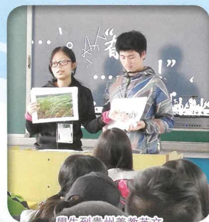
學生到貴州義教英文