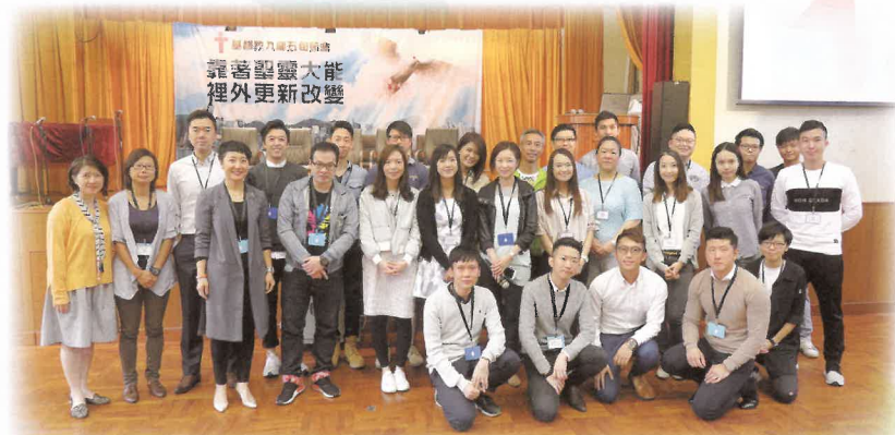
愛的傳承：畢業生回校與師弟妹分享職場心得