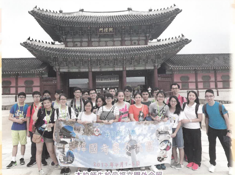
本校師生於景福宮門外合照