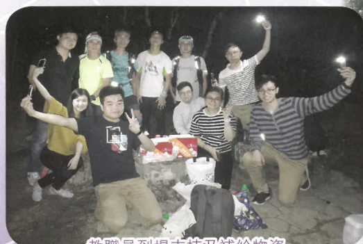
教職員到場支持及補給物資