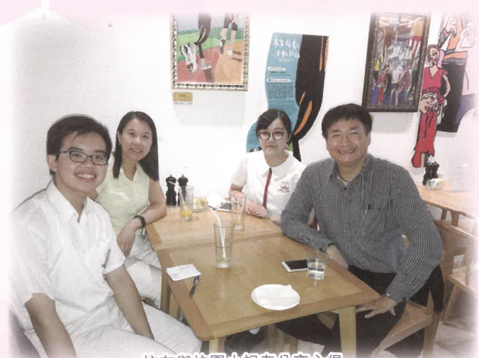
校友與校園小记者分享心得