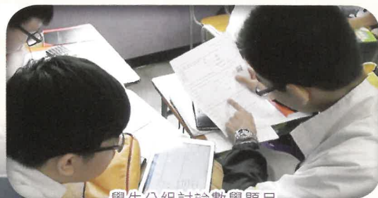
學生分組討論數學題目

總括而言，我們期望透過「翻轉課堂」促進學生自主學習，除了令他們知識有所增益之外，還訓練了他們的表達能力及互相協作的的能力，引發他們主動學習，燃點他們追求知識的動力，成為學習真正的主導者。