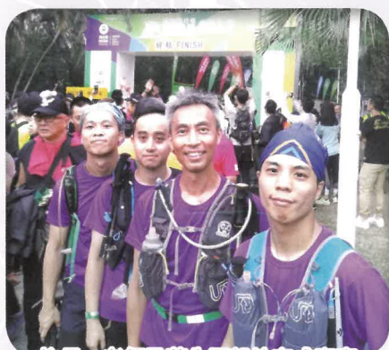
校長、老師及舊生堅毅地完成賽事

本校自2011年起便參加由樂施會舉辦的「毅行者」慈善籌款活動。本年度仍由校長、教職員及校友組成隊伍，以30小時13分47秒完成100公里的賽事，共籌得$43,518善款。師生以身體力行的方式參與慈善，在艱難卻又充滿挑戰性的賽事中，展現他們的毅力及團隊合作精神，籌得善款，造福社群。