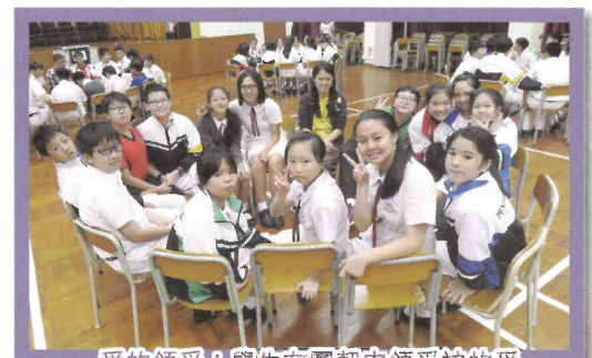
愛的領受：學生在團契中領受神的愛

使徒保羅在歌林多前書13章1-3節提醒我們：「我若能說萬人的方言，並天使的話語，卻沒有愛，我就成了鳴的鑼，響的鈸一般。我若有先知講道之能，也明白各樣的奧秘，各樣的知識，而且有全備的信，叫我能夠移山，卻沒有愛，我就算不得甚麼。我若將所有的賙濟窮人，又捨己身叫人焚燒，卻沒有愛，仍然與我無益。」教育若只能培養學生擁有優異的成績和技能，卻沒有愛心，算不得成功。「滿有愛心的優秀（Excellence With Love）」才是每位教育工作者所期盼的教育宗旨。