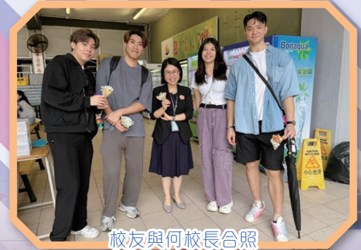
校友與何校長合照