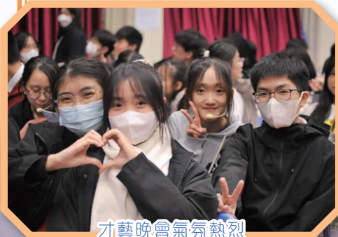
才藝晚會氣氛熱烈