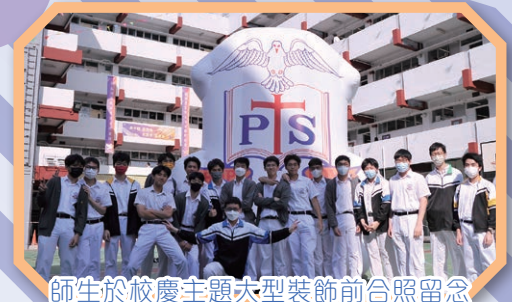
師生於校慶主題大型裝飾前合照留念