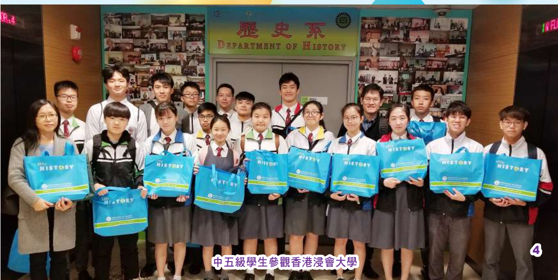
中五級學生參觀香港浸會大學