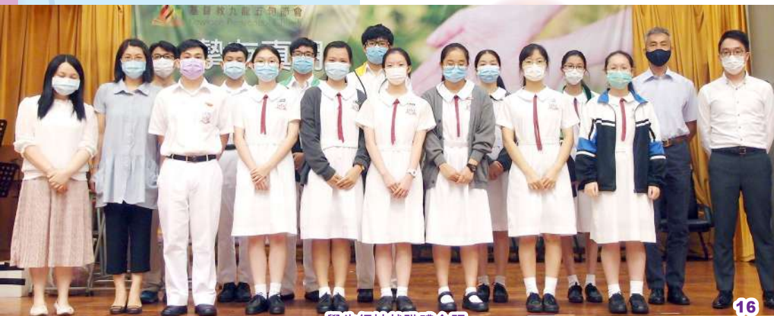
學生領袖就職禮合照