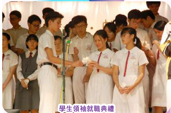
學生領袖就職典禮