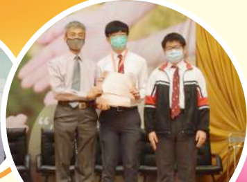
學生於香港國際數學競賽 晉級賽獲得佳績