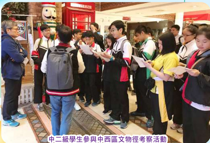
中二級學生參與中西區文物徑考察活動