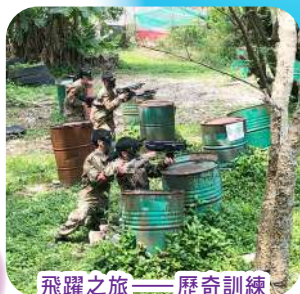
飛躍之旅——歷奇訓練