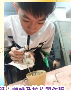
中三級職業技能訓練班：咖啡及拉花製作班