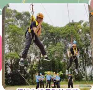
領袖生組長訓練日營

訓導組一向重視學生品德的培養，希望他們從教導中培養良好的品格，懂得「知禮守規、律己自重」的精神。