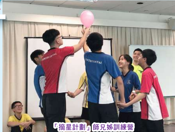
「摘星計劃」師兄姊訓練營

輔導組不僅聆聽學生的心聲，為他們提供心理輔導，陪伴他們經歷成長中的風風雨雨，更致力於創造一個和諧共融的校園環境，讓學生在身、心、社、靈不同範疇得到健康的成長。每年輔導組均會舉辦各種各樣的小組、工作坊、興趣課程、講座等活動，豐富學生的校園體驗，提升個人質素及能力，讓學生在與同學、老師的互動之中增進人際關係和對學校的歸屬感。本組曾推行的活動包括：「摘星計劃」、「多元體驗學習計劃」、「情緒管理小組」、「社交小組」、「生涯規劃小組」、「中英文讀寫班」、「為學生打戲」戲劇社交小組、「暑期社區關懷活動」、「網外創新天」抗網上沉溺小組、「義工小組」、「種出新Teen地」園藝治療小組等等。此外，本組亦與駐校社工機構——香港青少年服務處合辦活動，旨在為學生發掘多元潛能，增強學生對職業的認識，建立清晰的人生方向。