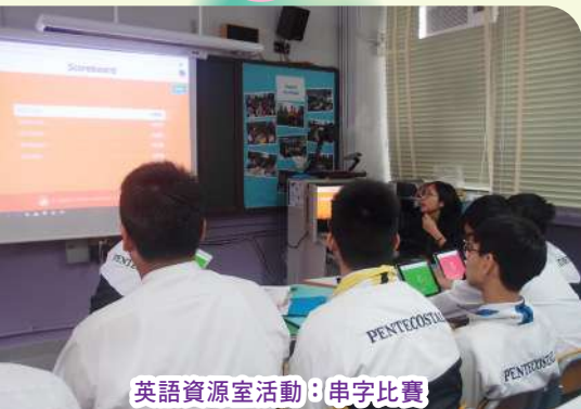
英語資源室活動：串字比賽