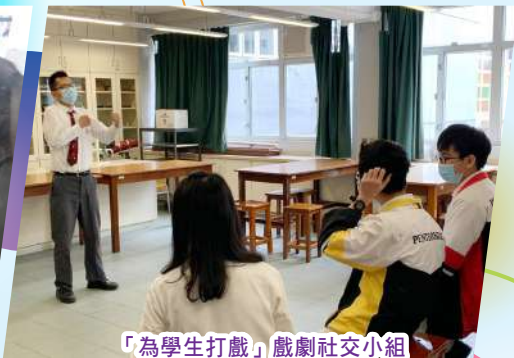
「為學生打戲」戲劇社交小組