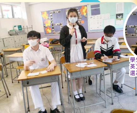
學生於香港中學 英文辯論比賽被 選為最佳辯論員