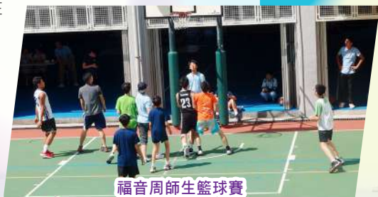
福音周師生籃球賽

社會對靈性教育愈來愈重視，因為可以幫助少年人學習尋找和建立生命的意義與方向，為學生傳遞正能量。本校在中一至中六級均開設聖經科，目的在幫助學生認識基督信仰的主要內容，從而指出如何經歷信仰中提及的豐盛人生。此外，學校每個循環周設立了宗教早會及三個團契，讓所有學生透過各樣形式活動與基督徒老師和同學彼此認識，擴闊視野，並在他們身上看到信仰如何落實於生活。此外，學校每年均舉辦福音周及不同的營會，例如福音營、讀經營及領袖訓練營，以多姿多彩的活動，幫助學生認識基督教信仰與生活之間的關係，及如何實踐信仰。辦學團體安排教會傳道人與學生探討信仰及幫助學生成長；同時亦安排了少年崇拜供學生自由參加。