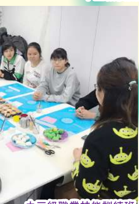
中三級職業技能訓練班：西式甜品製作班