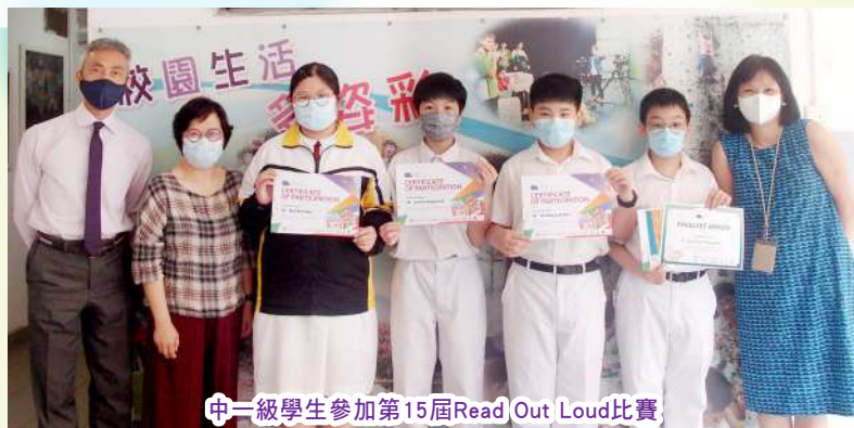
中一級學生參加第15屆Read Out Loud比賽