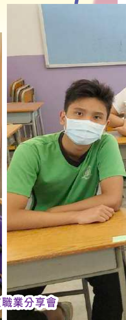
中六校友職業分享會