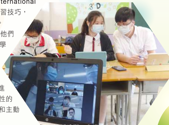
學校辯論隊正在進行網上比賽