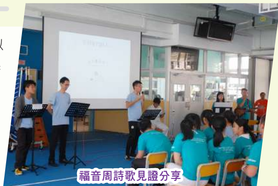
福音周詩歌見證分享