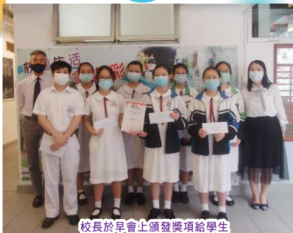
校長於早會上頒發獎項給學生

最後，為了「追求卓越、榮神益人」，學校設有「校外活動龍虎榜」。榜上張貼了校外獲獎的同學名單及與校長合照的相片以作表揚。