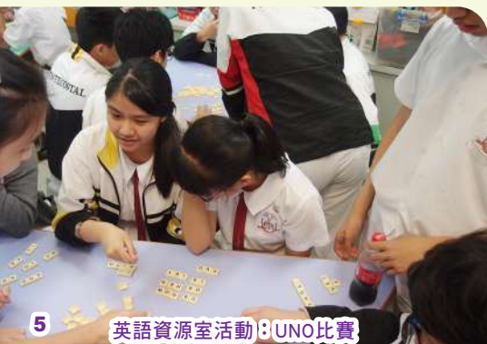
5 英語資源室活動：UNO比賽