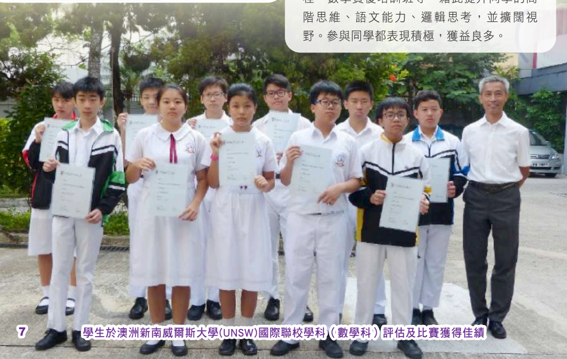
學生於澳洲新南威爾斯大學(UNSW)國際聯校學科(數學科)評估及比賽獲得佳績

本校設有資優教育栽培學生，每年均提名資優學生參加「香港資優教育學苑」課程，範疇包括數理及人文學科。同時，透過教育局的多元學習津貼，為本校高中資優學生舉辦校本培訓，包括：中文演辯隊、英文辯論隊、中國語文及英國語文科資優教育課程、數學資優培訓班等，藉此提升同學的高階思維、語文能力、邏輯思考，並擴闊視野。參與同學都表現積極，獲益良多。