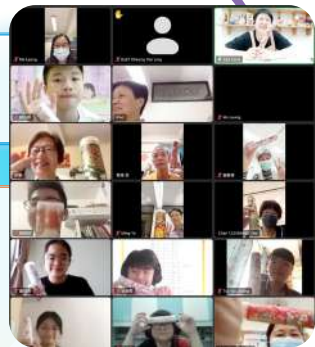
同學透過視訊會議參與長者學苑活動：製作萬花筒