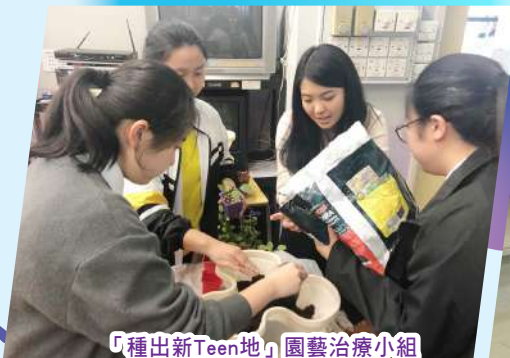
「種出新Teen地」園藝治療小組

輔導組不僅聆聽學生的心聲，為他們提供心理輔導，陪伴他們經歷成長中的風風雨雨，更致力於創造一個和諧共融的校園環境，讓學生在身、心、社、靈不同範疇得到健康的成長。每年輔導組均會舉辦各種各樣的小組、工作坊、興趣課程、講座等活動，豐富學生的校園體驗，提升個人質素及能力，讓學生在與同學、老師的互動之中增進人際關係和對學校的歸屬感。本組曾推行的活動包括：「摘星計劃」、「多元體驗學習計劃」、「情緒管理小組」、「社交小組」、「生涯規劃小組」、「中英文讀寫班」、「為學生打戲」戲劇社交小組、「暑期社區關懷活動」、「網外創新天」抗網上沉溺小組、「義工小組」、「種出新Teen地」園藝治療小組等等。此外，本組亦與駐校社工機構——香港青少年服務處合辦活動，旨在為學生發掘多元潛能，增強學生對職業的認識，建立清晰的人生方向。