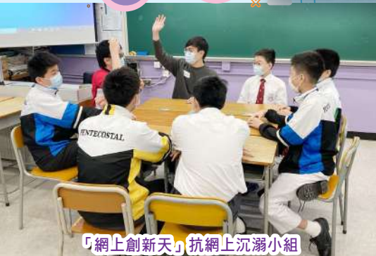
「網上創新天」抗網上沉溺小組