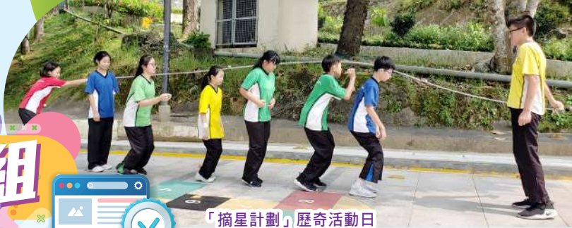
「摘星計劃」歷奇活動日