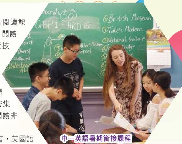
中一英語暑期銜接課程

在課程以外，英國語文科在英語資源室舉辦各種有趣及互動的英文活動，例如棋盤遊戲、串字比賽、英語手工藝及電影播放等，亦透過不同形式的活動及興趣小組如英語辯論隊、英詩朗誦隊等，讓同學沉浸在豐富的英語學習環境中。