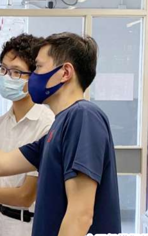
中五級模擬放榜工作坊