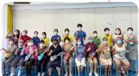
長者學苑活動：製作UKULELE