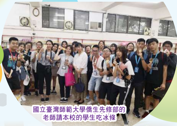
國立臺灣師範大學僑生先修部的老師請本校的學生吃冰條