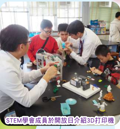
STEM學會成員於開放日介紹3D打印機

世界科技發展日新月異，學習亦應與時並進，STEM教育成為學習新趨勢。為配合時代發展，本校於2018年起開展STEM教育的各項活動。