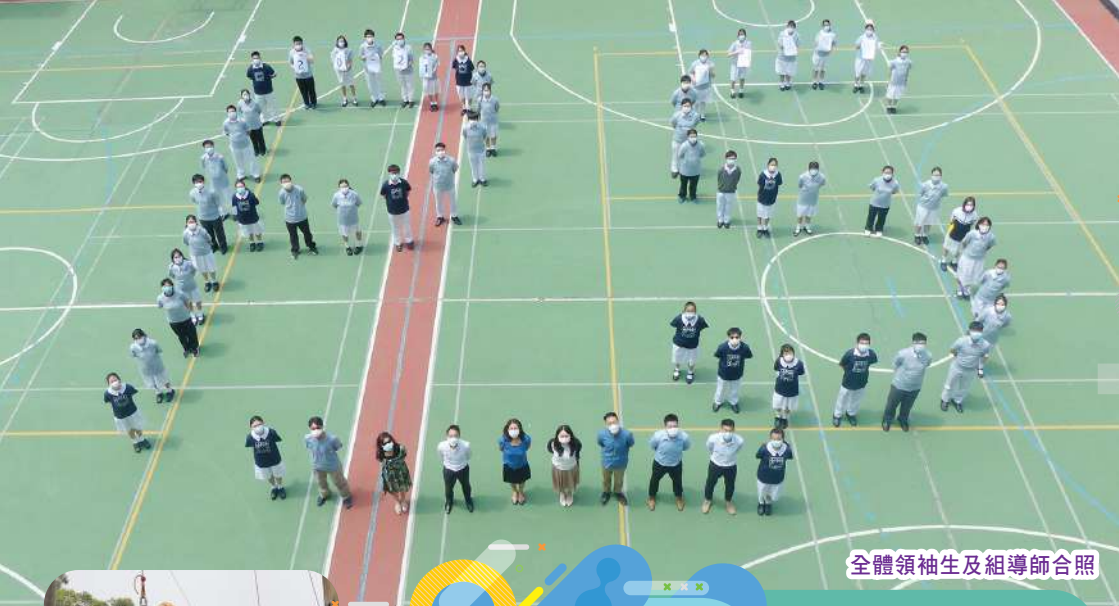
全體領袖生及組導師合照