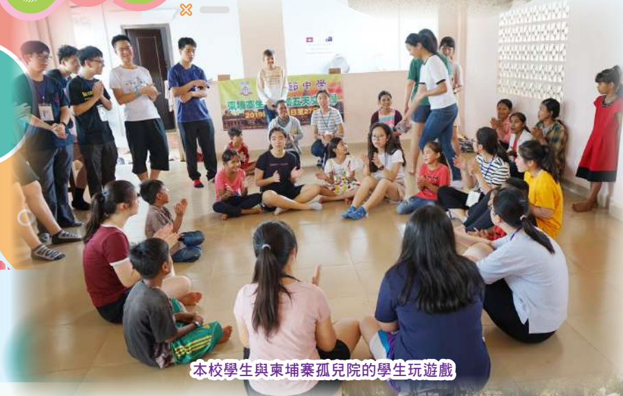
本校學生與柬埔寨孤兒院的學生玩遊戲