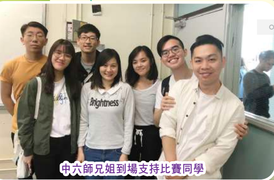
中六師兄姐到場支持比賽同學

本校設有資優教育栽培學生，每年均提名資優學生參加「香港資優教育學苑」課程，範疇包括數理及人文學科。同時，透過教育局的多元學習津貼，為本校高中資優學生舉辦校本培訓，包括：中文演辯隊、英文辯論隊、中國語文及英國語文科資優教育課程、數學資優培訓班等，藉此提升同學的高階思維、語文能力、邏輯思考，並擴闊視野。參與同學都表現積極，獲益良多。