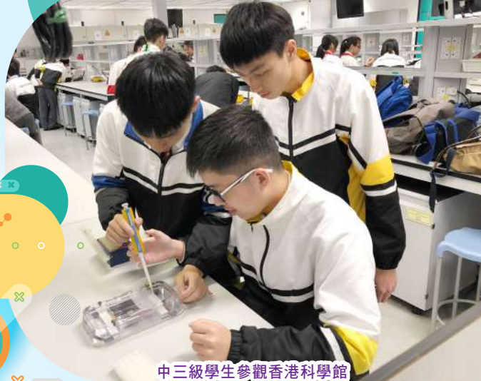
中三級學生參觀香港科學館

本校設立全方位學習日，活動目的旨在將學習從課室帶到社區，帶領學生到不同地方作交流，從而擴闊眼界，增廣見聞，並以探究形式去學習書本以外的知識，寓學習於生活。