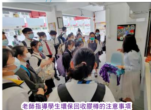
老師指導學生環保回收膠樽的注意事項