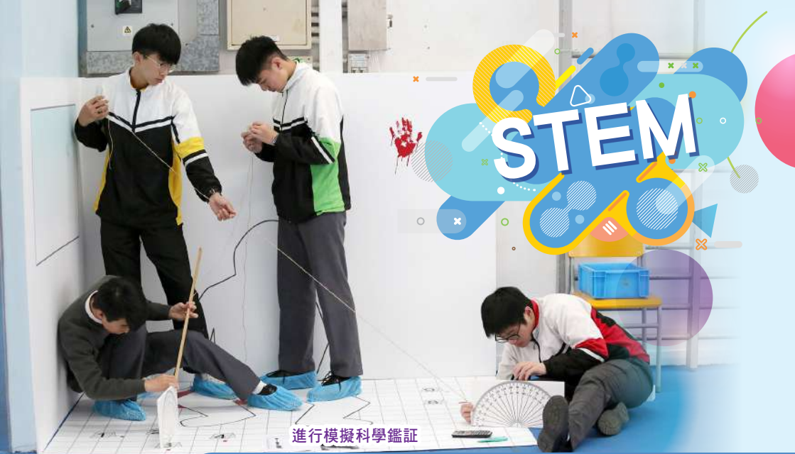
進行模擬科學鑑証

世界科技發展日新月異，學習亦應與時並進，STEM教育成為學習新趨勢。為配合時代發展，本校於2018年起開展STEM教育的各項活動。