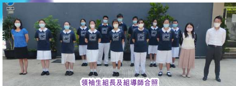
領袖生組長及組導師合照