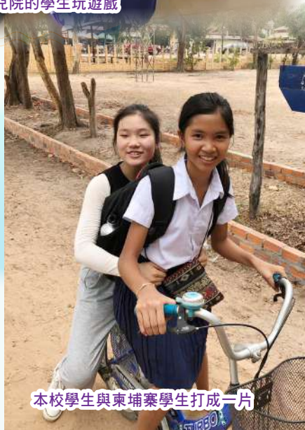
本校學生與柬埔寨學生打成一片

除此之外，本校亦透過考察交流團協助學生進行生涯規劃。例如本校曾分別於暑假舉辦新加坡和台灣考察交流團。透過探訪當地的大專院校，學生可以了解當地的學習文化和升學途徑，為學生未來升學發展提供更豐富的資訊。