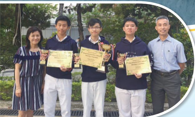
學生於「香港中學英文辯論比賽」獲得佳績