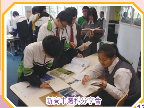
新高中選科分享會