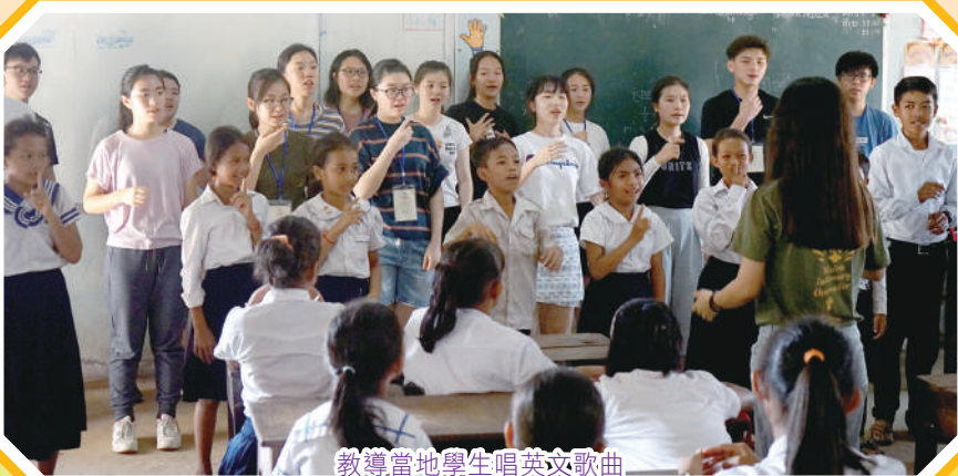
教導當地學生唱英文歌曲