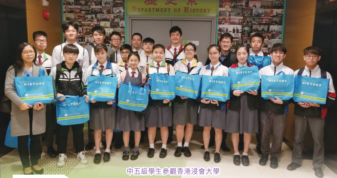
中五級學生參觀香港浸會大學