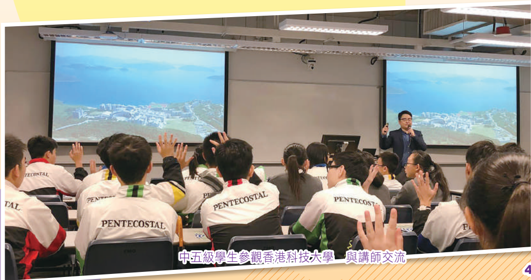
中五級學生參觀香港科技大學 與講師交流