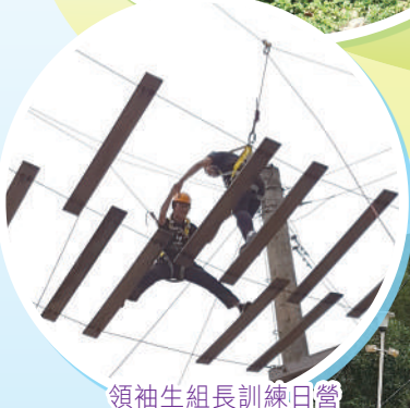
領袖生組長訓練日營