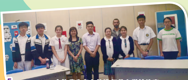
5 本校學生與友校進行英文辯論比賽

英國語文科十分著重培養學生的閱讀能力，因此於初中推行「廣泛閱讀計劃」及「閱讀獎勵計劃」，有系統地教導學生掌握閱讀技巧。同時，為了培養學生的自主學習習慣，英國語文科與外間機構合作，提供網上閱讀平台。英國語文科每年更會訓練一群中三至中六的同學為閱讀大使，藉以推動同儕伴讀，增加全校閱讀氣氛。閱讀大使經過密集的訓練後，都能有效地帶領中二級的同學去掌握一些閱讀非故事性書本的技巧。