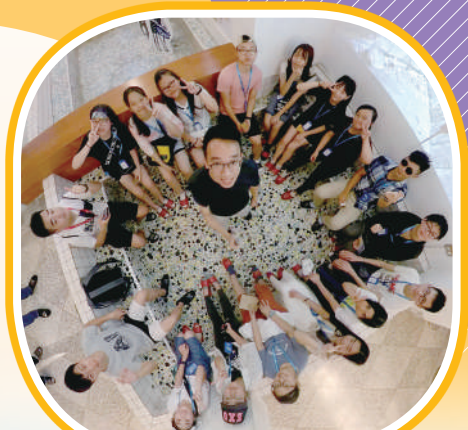
台灣交流團：師生於地熱谷合照

本校亦於前年暑假期間舉行了台灣考察交流團，學生參觀了國立臺灣師範大學僑生先修部，讓學生更了解台灣的升學途徑。此外，學生亦參觀了西門紅樓、九份老街、士林夜市和野柳地質公園等地方，使學生能親身了解台灣的社會、經濟、歷史文化特色。