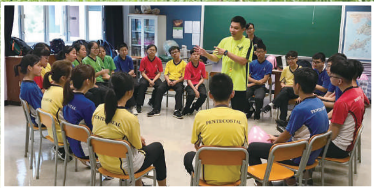
摘星計劃師兄姐訓練營

輔導組不僅聆聽學生的心聲，為學生提供心理輔導，陪伴學生經歷成長中的風風雨雨，更致力於創造一個和諧共融的校園環境，讓學生在身、心、社、靈不同範疇得到健康的成長。每年輔導組均會舉辦各種各樣的小組、工作坊、興趣課程、講座以及活動，豐富學生的校園體驗，提升個人質素及能力，讓學生在與同學、老師的互動之中增進人際關係和對學校的歸屬感。本組推行的活動包括：「摘星計劃」、「多元體驗計劃」、「情緒管理小組」、「情緒社交小組」、「生涯規劃小組」、「中英文讀寫班」、「ukulele訓練班」、「野戰活動」、「魚菜共生戶外體驗工作坊」、「SuperPark體驗之旅」、「黑暗中對話體驗之旅」等等。此外，本組亦與社福機構協青社合辦「立『職』行動」生涯規劃活動，旨在為學生發掘多元潛能，增強學生對職業的認識，建立清晰的人生方向。