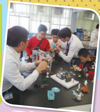
STEM學會成員於開放日介紹3D打印機