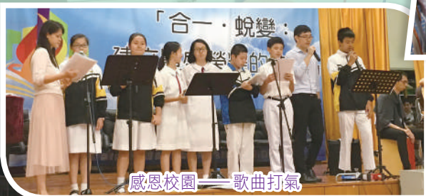
感恩校園——歌曲打氣