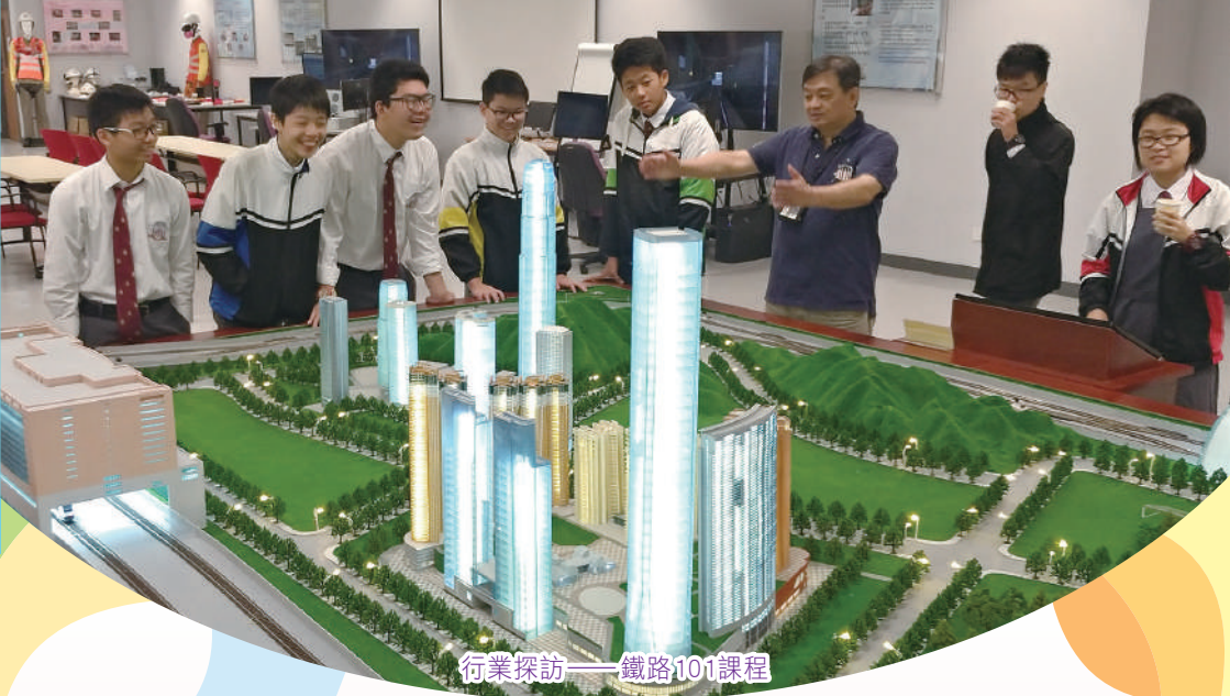
行業探訪——鐵路101課程

為提高高中同學對大學聯招及畢業後多元出路的認識，並提供最新升學及就業資訊，本組特意邀請學友社舉辦家長晚會講座，又邀請畢業生回校分享學習及工作心得。同時，本組透過生涯規劃教育課程、版圖遊戲教材及諮商輔導服務，協助同學規劃前路，探索人生方向。