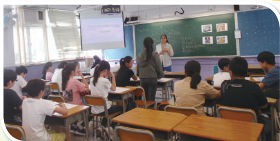
中一英語暑期銜接課程上課情況