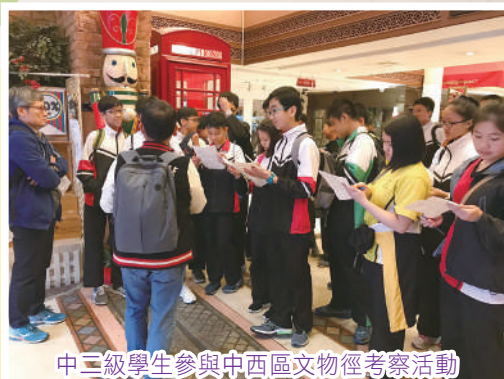
中三級學生參與中西區文物徑考察活動

本校設立全方位學習日，活動目的旨在將學習從課室帶到社區，帶領學生到不同地方作交流，從而擴闊眼界，增廣見聞，並以探究形式去學習書本以外的知識，寓學習於生活。