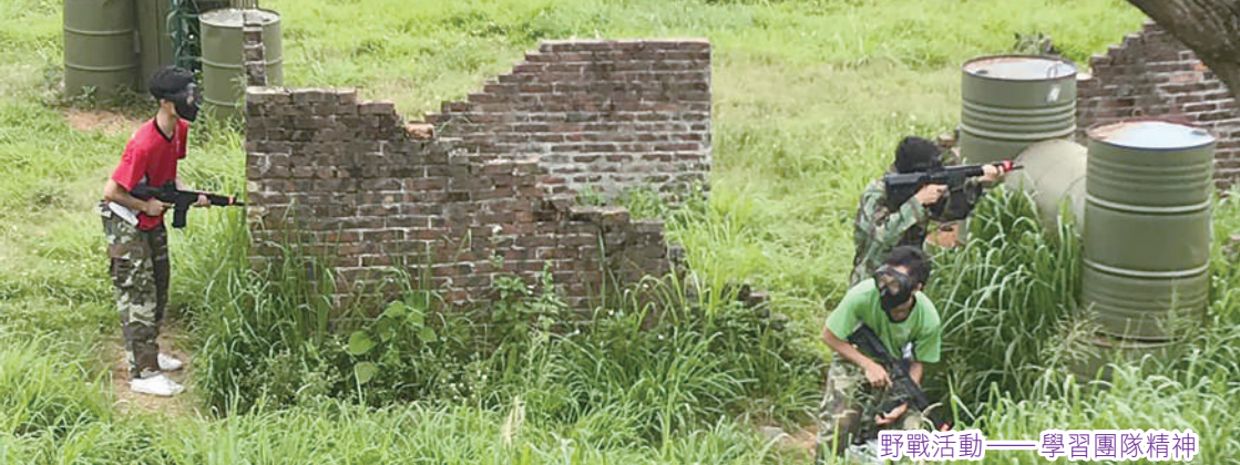
野戰活動——學習團隊精神