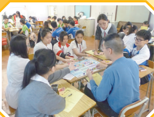
生涯規劃理財桌上遊戲工作坊

為配合教育局生涯規劃的發展，本校訂定了校本的生涯路線圖及口號「SMART-D」。「SMART-D」的願景是希望同學能循序漸進，從認識自我，發展潛能，最後達至夢想的實踐 (Dreams come true)。本組推行多項與工作相關的活動，包括：性向測試、校友職業分享會、職場參觀及探訪、職業技能培訓班、模擬營銷工作坊和暑期工作實習計劃，藉此協助學生了解自己，探索個人對職業的選擇，加深他們對工作世界的認識和了解。