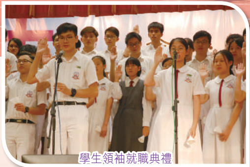
學生領袖就職典禮

為推展協助學生成長工作，學生發展組轄下成立了七個功能小組，包括宗教組、訓導組、輔導組、課外活動組、升學及就業輔導組、公民及品德教育組、學生支援組。各功能小組的正副召集人連同副校長（學生事務）組成學生發展組，透過定期會議，協調和監察各項工作。本校校長及全體老師，定必本著天父的慈愛，教養每一位學生，盼望學生離開母校時，成為一個自勵、上進、盡責、滿懷信心、盼望和愛心的人。為配合全校性發展目標，學生發展組於本學年將重點建立正向校園文化，繼而促進學生健康成長。