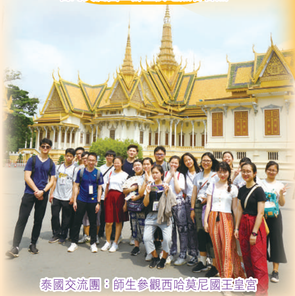
泰國交流團：師生參觀西哈莫尼國王皇宮