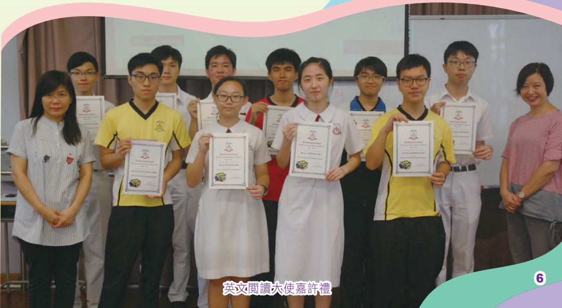
英文閱讀大使嘉許禮