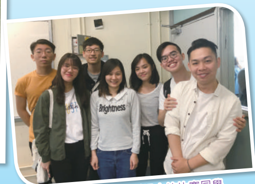
中六師兄姐到場支持比賽同學