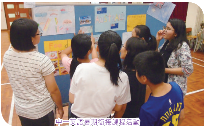
中一英語暑期銜接課程活動

在課程以外，英國語文科在英語資源室舉辦各種有趣及互動的英文活動，例如棋盤遊戲、串字比賽、英語手工藝及電影播放等。亦透過不同形式的活動及興趣小組如英語辯論隊、英詩朗誦隊等，讓同學沉浸在豐富的英語學習環境中。