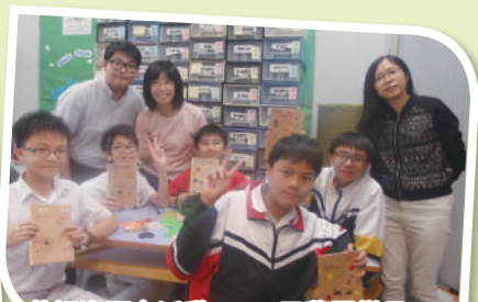
英語資源室活動：DIY 工藝同樂日