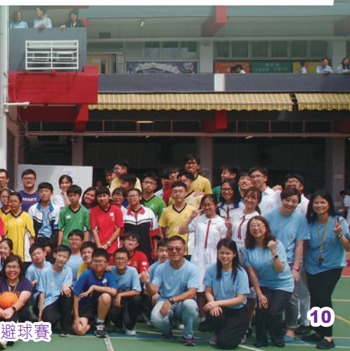
福音周——師生閃避球賽