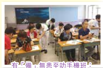
有「備」無患至叻手機班： 同學教導長者使用手機