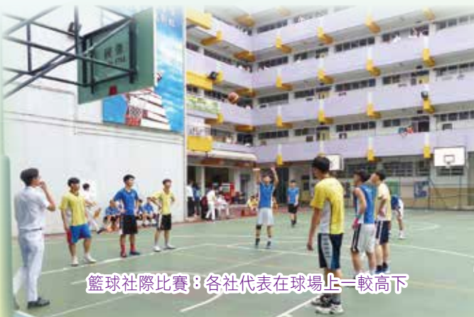
籃球社際比賽：各社代表在球場上一較高下

最後，為了「追求卓越、榮神益人」，學校設有「校外活動龍虎榜」。榜上張貼了校外獲獎的同學名單與校長合照的相片以作表揚。