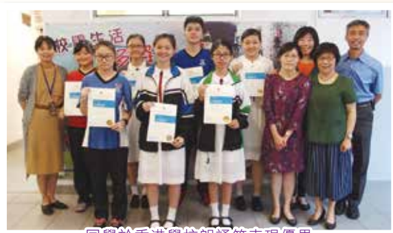
同學於香港學校朗誦節表現優異

此外，本年中一英語銜接課程以主題形式進行，讓同學活用英語，積極參與各項富挑戰性的聽、講、讀、寫活動，從而建立同學的自信和主動學習的態度。