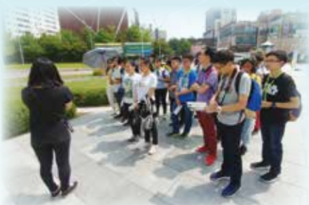
師生在南韓梨花女子大學與當地學生交流

在去年的南韓考察交流團，同學既能透過參觀韓國的歷史古蹟如景福宮，了解韓國的歷史文化，又能透過參觀明洞和東大門，了解南韓的潮流文化。