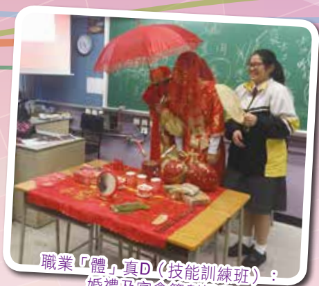
職業「體」真D (技能訓練班) : 婚禮及宴會籌劃課程

為提升高中同學對大學聯招及畢業後多元出路的認識，及提供最新升學及就業資訊，本組特意邀請學友社舉辦家長講座晚會，又邀請畢業生回校分享學習及工作心得。同時，本組透過生涯規劃教育課程，協助同學規劃前路。