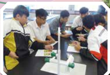
福音周活動・初年級佈道會陪談