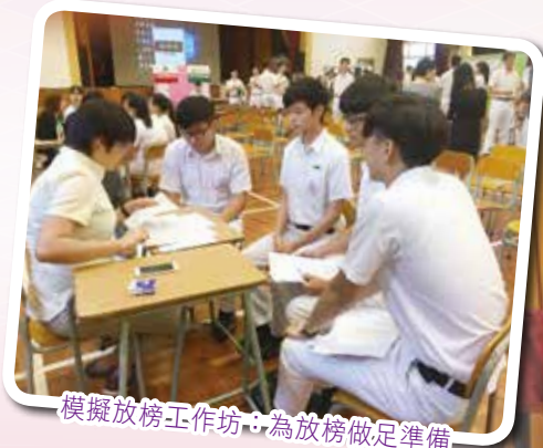
模擬放榜工作坊：為放榜做足準備