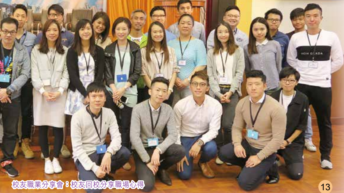
校友職業分享會：校友回校分享職場心得