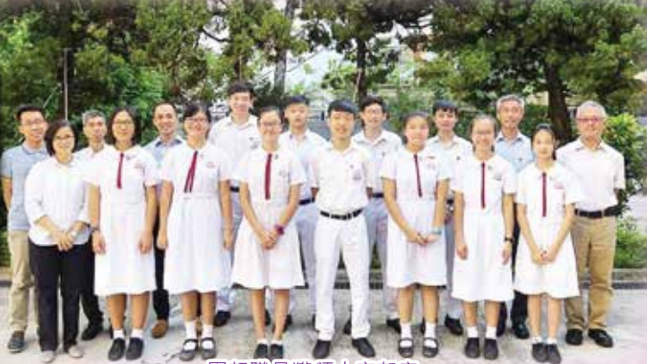
團契職員獲頒十字架章