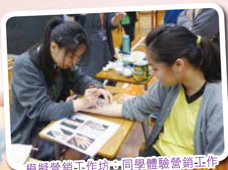
模擬營銷工作坊：同學體驗營銷工作