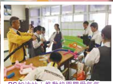
PS加油站：推動校園關愛氣氛