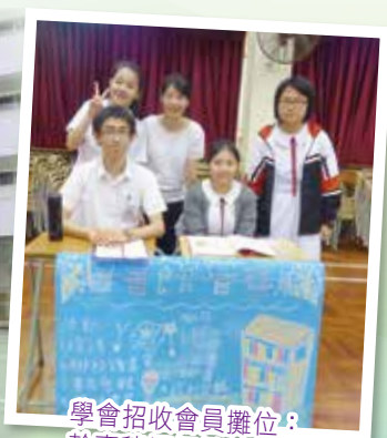
學會招收會員攤位：幹事積極招攬新會員