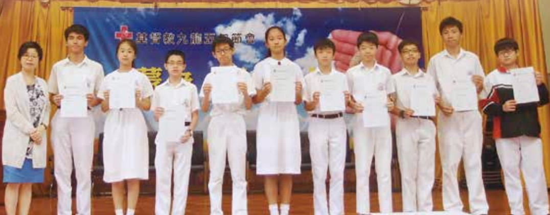
本校學生獲頒發澳洲新南威爾斯大學國際聯校學科評估及比賽(科學科)得獎證書