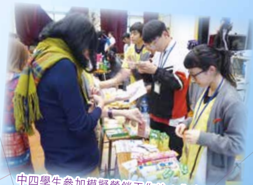
中四學生參加模擬營銷工作坊：售賣零食