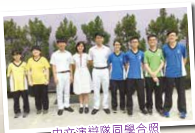
中文演辯隊同學合照