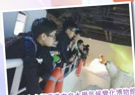
中一學生參觀香港中文大學氣候變化博物館