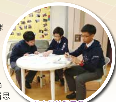
英文辯論隊同學積極備戰

本校每年均提名資優生參加「資優教育學院」課程，範疇涵蓋數理及人文學科。此外，本校更全數資助初中資優生參加由大專院校舉辦的資優解難課程；高中方面，則透過教育局多元學習津貼，為資優學生舉辦校本培訓，如中、英演辯訓練、普通話演說訓練、中英文特訓、高等數學培訓等，藉此提升同學的高階思維、語文能力、邏輯思考，並擴闊視野。參與同學表現積極，獲益良多。