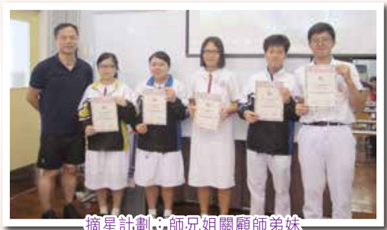
摘星計劃：師兄姐關顧師弟妹

此外，本組更安排生命導師照顧個別有特殊需要的學生，幫助他們健康成長。同時，本組為全體學生提供補救性、預防性及發展性的輔導服務，並為有需要的學生提供個別／小組輔導或轉介評估服務等。