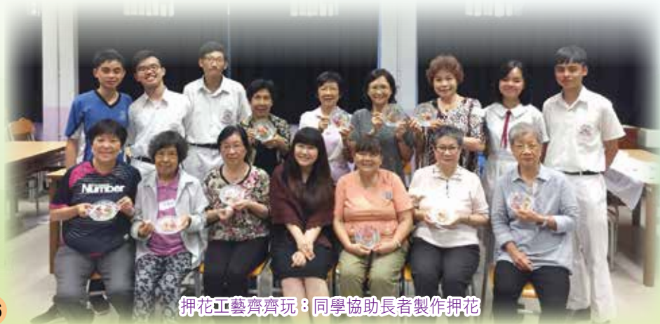
押花工藝齊齊玩：同學協助長者製作押花