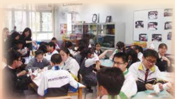
英文資源室活動：手工活動

英國語文科十分著重培養學生的閱讀能力，有系統地教導學生掌握閱讀技巧，訓練他們開聲誦讀課文，於初中推行「廣泛閱讀計劃」，還有鼓勵全校學生參加「閱讀獎勵計劃」，於閱讀書本後能撰寫優質的報告就可加額外的分數；