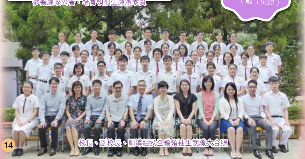
校長、副校長、訓導組及全體領袖生就職大合照