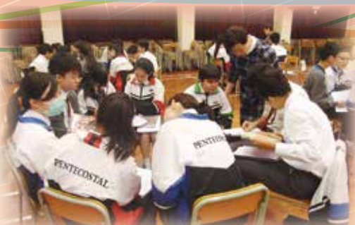
英文閱讀大使計劃：同學分享閱讀心得

為了讓學生能正確地發出標準英語的讀音，英國語文科特意加強教導學生學習國際語言音標(International Phonetic Alphabet)，冀望他們能掌握此學習技巧，自信地學好英語，有助他們日後升學或就業。