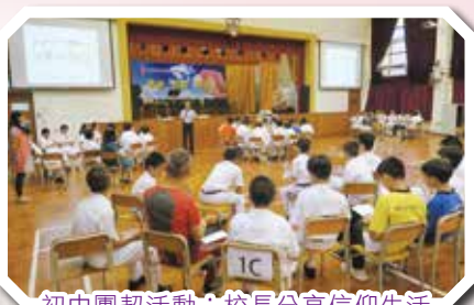
初中團契活動・校長分享信仰生活

社 會對靈性教育愈來愈重視，因為可以幫助少年人學習尋找和建立生命的意義與方向，期望在學生心中帶出正能量。本校在中一至中六級均開設聖經科，目的在幫助各級別的學生認識基督信仰的主要內容，從而指出如何經歷信仰中提及的豐盛人生。另外學校每個循環周設立了兩個學生團契，讓各年級學生透過不同的活動與基督徒老師和同學彼此認識，擴闊視野，並在他們身上看到信仰的真實。此外，學校每年均舉辦福音周及不同內容的宗教性活動，亦按學生的需要舉辦福音營、讀經營或訓練營，以多姿多彩的活動，幫助學生認識基督教信仰與生活之間的關係，以及如何實踐信仰。辦學團體安排教會傳道人與學生探討信仰及幫助學生成長；同時亦安排了少年崇拜供學生自由參加。