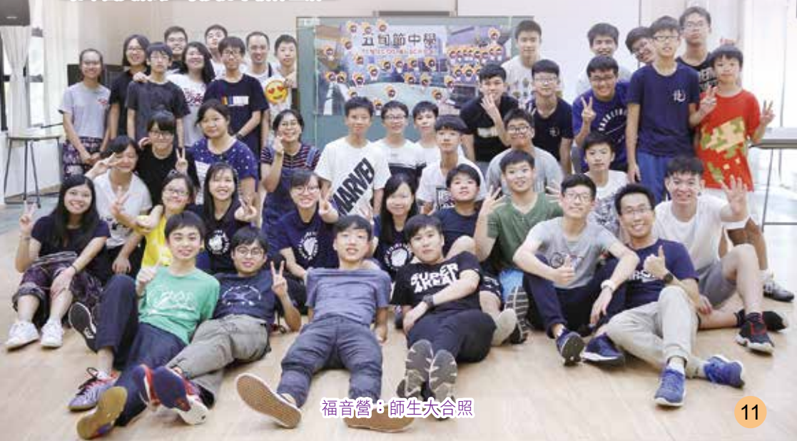
福音營・師生大合照