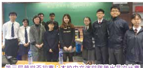
第三屆華辯盃初賽：本校中文演辯隊勝出是次比賽