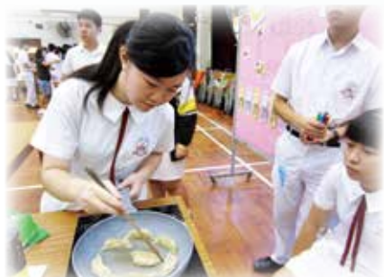
遊藝會攤位：品嚐同學手製美食

本校每周都有操場集會，好讓同學推廣活動和發揮創意宣傳技巧，同時亦藉此表揚在校內或校外比賽表現優異的同學。課外活動操場集會的所有宣傳及頒獎皆以英語或普通話進行，使學生有多聽多講的機會，從而增強自信心，效果顯著。