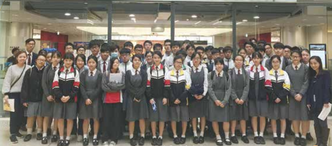
中五學生參觀城市大學