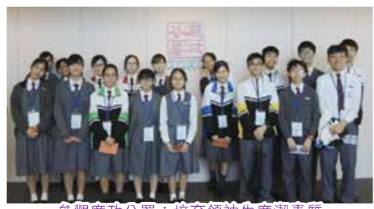
參觀廉政公署，培育領袖生廉潔素質

訓導組除處理日常學生的紀律事宜外、更為學校督導和培訓一批精英—領袖生團隊，以協助老師維持校園秩序。為了提升領袖生之素質，本組每年多次舉辦領袖生組長訓練營和領袖生訓練營。領袖生與組導師更會定期開會檢討工作及個別領袖生之表現。