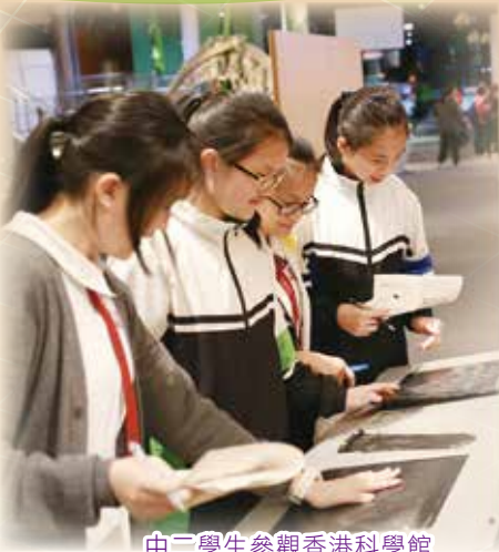
中二學生參觀香港科學館

為 配合新高中科學課程的發展和需要，本校初中科學科在校本課程及教學策略上作出了相應的調適及改良。自2011年起，本校參加了優質教育基金科學學習領域課程發展計劃，推動以能力為本的評核和活動教學模式，用以培養學生的科學過程技能及探究精神。此外，自2015年起，本校初中科學科更參加了「大學——學校支援計劃」，推行以電子學習支援科學探究的學習模式，以此培養學生的自主學習能力。在課程之外，本校亦鼓勵學生積極參加校外比賽及活動，藉此擴闊同學視野，並提升他們對學習科學的興趣和自信。