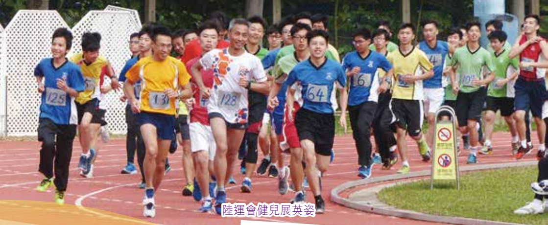
陸運會健兒展英姿