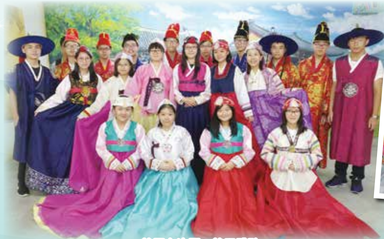
韓國交流團：韓服體驗

此外，交流團亦積極推動本校學生到不同地方服務、體驗生活。如去年的貴州生活體驗交流團，本校安排了數十位同學到貴州一所小學義教，透過策劃和進行不同的義教活動，增加了學生面對群眾的信心，亦能令學生更加了解自身的優點和缺點。