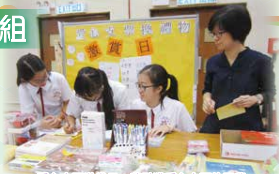
愛心支票激賞日：獎勵獲愛心支票的同學