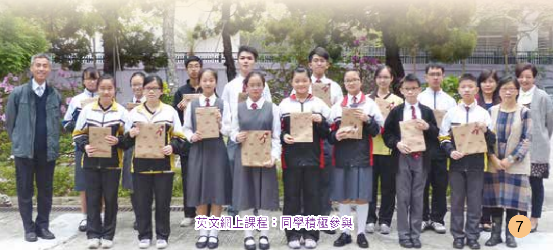
英文網上課程：同學積極參與