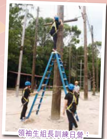
領袖生組長訓練日營： 培育組長領導能力

全校共有八位訓導老師，處理同學在訓育上的需要和疑難。此外，為了學生能得到適時和恰當的照顧，本組更會定期與輔導組老師交流。