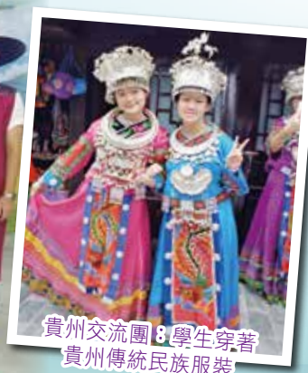
貴州交流團 8 學生穿著貴州傳統民族服裝