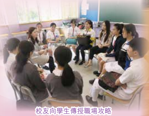
校友向學生傳授職場攻略