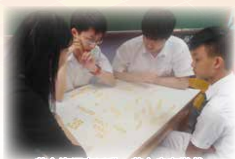
英文資源室活動：英文串字遊戲

英國語文科配合新高中的課程需要，發展校本課程，搜尋及設計不同類型的教材，並因應學生需要作出改善，持續發展。在高中課程中，除了戲劇單元外，英國語文科更以「職場英語溝通」(Workplace Communication)及時事議題(Social Issues)為選修單元，好讓學生掌握實用英語及提升學生的分析能力。