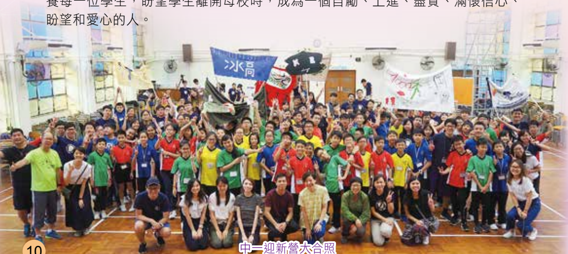
中一迎新營大合照