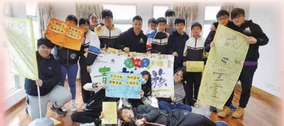
清新一族計劃：建立積極向上的人生觀