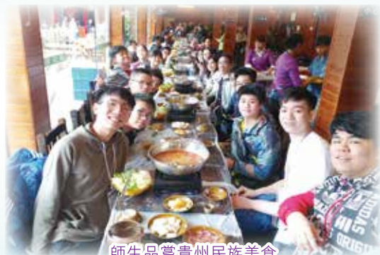
師生品嚐貴州民族美食

此外，交流團亦積極推動本校學生到不同地方服務、體驗生活。如去年的貴州生活體驗交流團，本校安排了數十位同學到貴州一所小學義教，透過策劃和進行不同的義教活動，增加了學生面對群眾的信心，亦能令學生更加了解自身的優點和缺點。