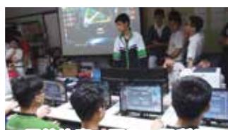
電競比賽：同學一展所長