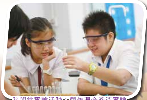
科學堂實驗活動・製作混合溶液實驗