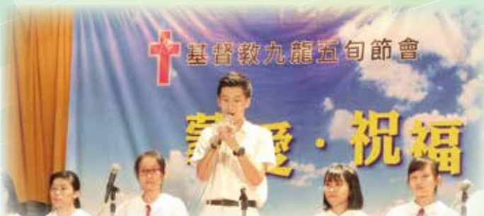
學生會選舉：候選內閣向同學介紹政綱

本校今年共有26個課外活動組織和23個服務組織，包括宗教、學術、興趣、文化藝術、體育運動及義工服務六個範疇。另外本校亦設有不同的科組和委員會，經常舉行不同類型的活動，切合同學的需要。