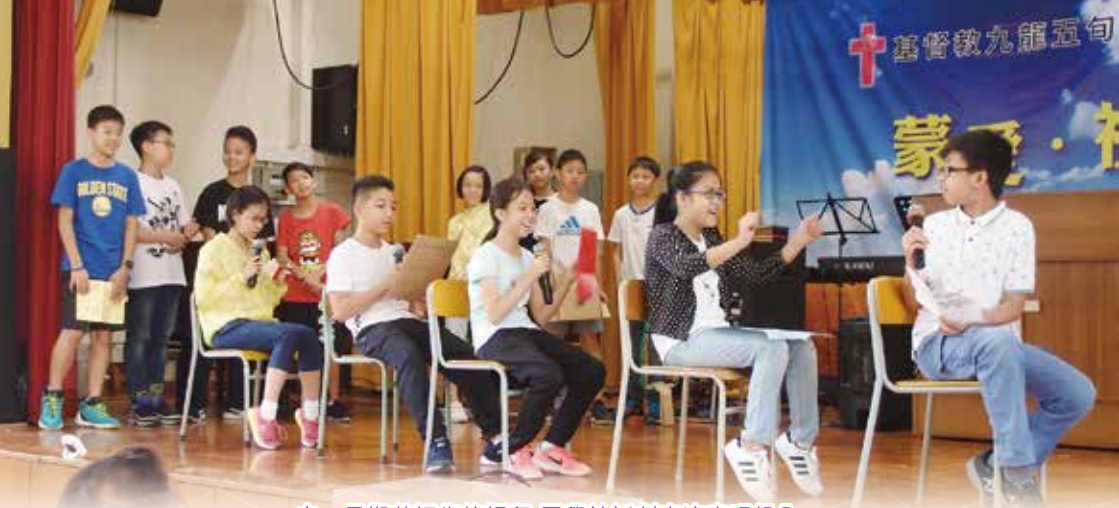
中一暑期英語銜接課程 同學於話劇表演表現投入