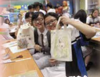
透過藝術創作放鬆身心