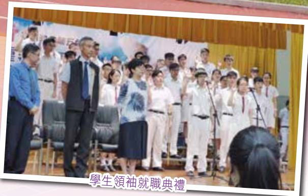
學生領袖就職典禮

及支援，並透過不同的活動，協助學生裝備自己，為健康成長奠定堅實的基礎。為推展協助學生成長工作，學生發展組轄下成立了六個功能小組，包括宗教組、升學及就業輔導組、訓導組、輔導組、公民及品德教育組及課外活動組。各功能小組的正副召集人連同副校長（學生事務）組成學生發展組，透過定期會議，協調和監察各項工作。本校校長及全體老師，定必本著天父的慈愛，教養每一位學生，盼望學生離開母校時，成為一個自勵、上進、盡責、滿懷信心、盼望和愛心的人。