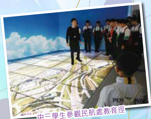
中三學生參觀民航處教育徑