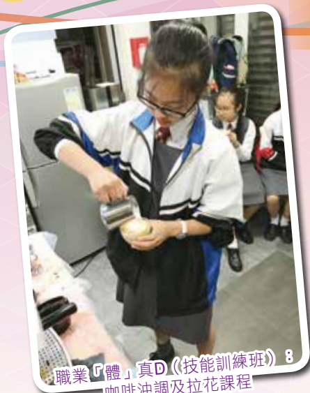
職業「體」真D (技能訓練班) 8 咖啡沖調及拉花課程

為配合教育局生涯規劃的發展，本組訂定了校本的生涯路線圖及口號「SMART-D」。「SMART-D」的願景是希望同學能循序漸進，從認識自我，發展潛能，最後達至夢想的實踐。本組推行多項與工作相關的活動，包括：校友職業分享會、職業技能培訓班、「模擬營銷工作坊」和暑期工作實習計劃，如參與港鐵的「『Train』出光輝每一程」訓練計劃和僱員再培訓局的「中學生暑期實