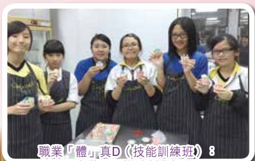
職業「體」真D (技能訓練班) 8 西式甜品及糕點製作課程