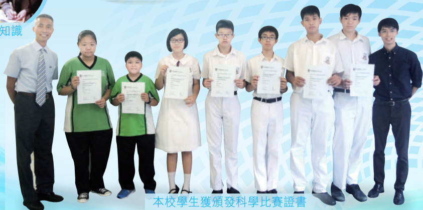
本校學生獲頒發科學比賽證書