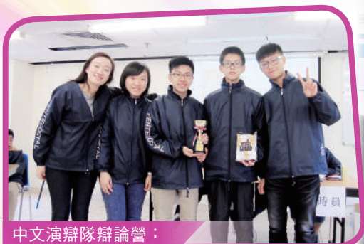
中文演辯隊辯論營： 訓練同學演辯技巧

本校每年均提名資優生參加「資優教育學院」課程，範疇涵蓋數理、人文學科及領袖才能等。此外，本校更全數資助初中資優生參加由大專院校舉辦的資優解難課程；高中方面，則透過教育局多元學習津貼，為資優學生舉辦校本培訓，如中、英演辯訓練、普通話演說訓練、中英文特訓、高等數學培訓等，藉此提升同學的高階思維、語文能力、邏輯思考，並擴闊視野。參與同學表現積極，獲益良多。