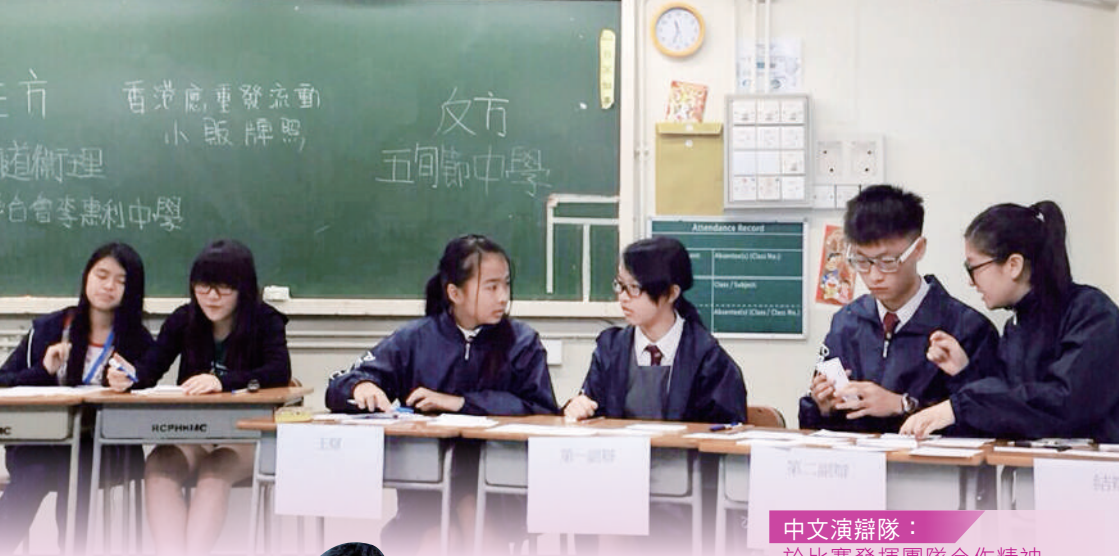
中文演辯隊： 於比賽發揮團隊合作精神