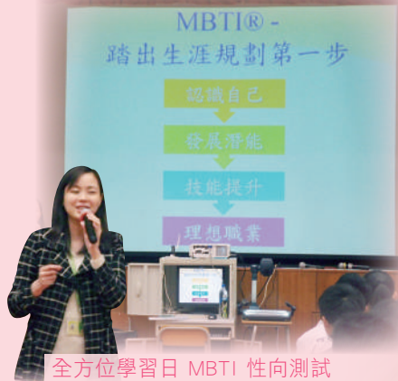
全方位學習日 MBTI 性向測試

本組除了提供最新的升學及就業資訊外，亦運用了教育局的生涯規劃津貼，推行更多與工作相關的活動，包括：講座、技能培訓工作坊、營商體驗遊戲、暑期工作實習計劃、性向測驗、參觀工商或教育機構等，藉此協助學生探索個人對職業的選擇，加深他們對工作世界的認識。