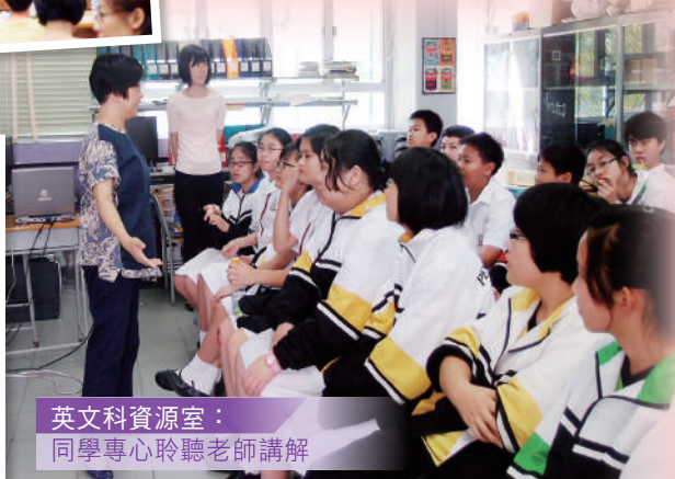
英文科資源室： 同學專心聆聽老師講解