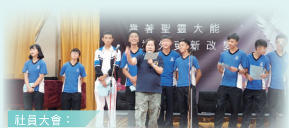
社員大會： 幹事宣誓