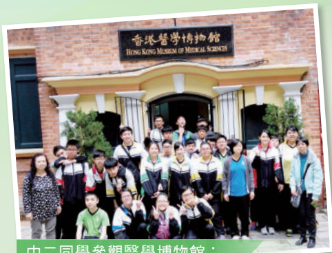
中二同學參觀醫學博物館： 認識醫學歷史