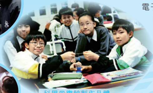
科學堂實驗製作晶體