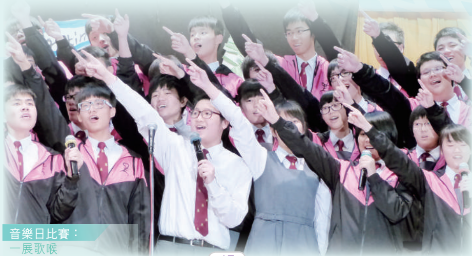
音樂日比賽： 一展歌喉