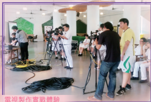
電視製作實戰體驗