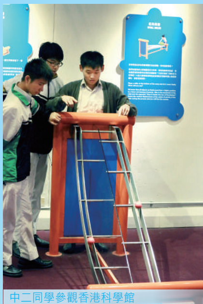
中二同學參觀香港科學館

為配合新高中科學課程的發展和需要，本校初中科學科在校本課程及教學策略上作出了相應的調適及改良。自2011-2012年度起，本校參加了優質教育基金科學學習領域課程發展計劃，推動以能力為本的評核和活動教學模式，加強訓練及培養學生的科學過程技能及探究精神。透過分組小班教學，中一及中二級學生能更有效掌握以英語學習科學知識的語文能力，為將來修讀高中及大學以英語為教學語言的科學課程建立穩固基礎。本校亦鼓勵學生積極參加校外比賽及活動，藉此擴闊同學視野，並提升他們對學習科學的興趣和自信。本年度，本校初中科學科更參加了「大學——學校支援計劃」，推行以電子學習支援科學探究的學生學習，目標是培養及發展學生的自主學習能力。