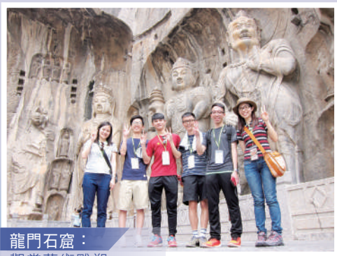
龍門石窟： 觀賞藝術雕塑

本校每年都舉辦考察交流團，交流團以學習為主，整個學習過程主要由學生主導，令他們走出課室，跳出書本的限制，親身了解香港以外的各地社會、經濟、歷史文化和體驗各地的生活。以上年度暑假的河南交流團和台灣交流團為例，同學除了欣賞中國河南雲台山國家地質公園的壯麗景色外，亦參觀了台灣的北投垃圾焚化廠，從中反思香港環境保育的不足。此外，交流團亦積極推動本校學生與不同地方的學生交流，如訪問河南鄭州十一中學，透過與當地的學生傾談，了解他們的學習模式，加強學生待人接物的技巧，並學會尊重不同地方的文化。