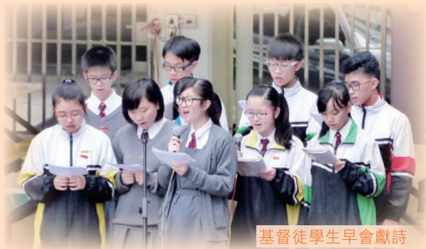
基督徒學生早會獻詩

此外，學校每年均舉辦福音周及不同內容的福音集會，並按需要舉辦福音營、讀經營或訓練營。本校設有宗教室，辦學團體安排教會傳道人與學生探討信仰及幫助學生成長；同時亦安排了少年崇拜供學生自由參加。本校以多姿多彩的活動，幫助學生認識基督教信仰與生活之間的關係，及如何實踐信仰。