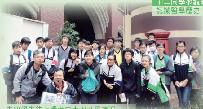
中四學生往上環考察土地利用情況