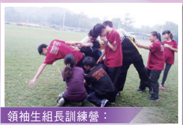
領袖生組長訓練營： 培育組長領導能力