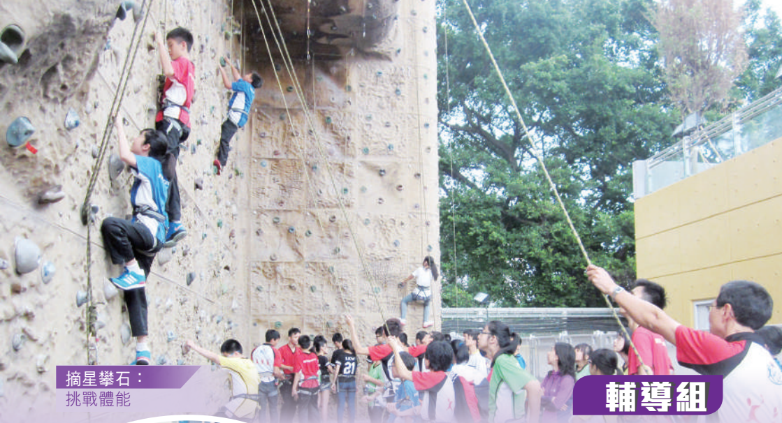
摘星攀石： 挑戰體能