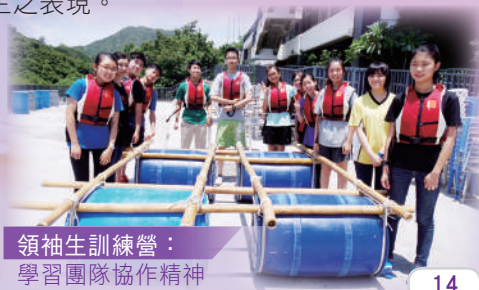
領袖生訓練營： 學習團隊協作精神