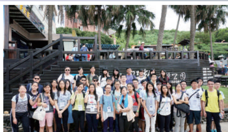
台灣野柳地質公園： 考察地質、豐富地理知識