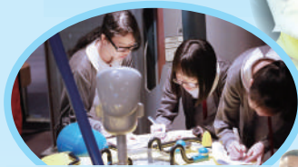
同學們認真學習科學知識