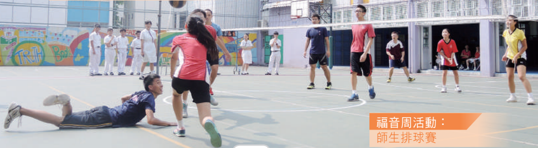
福音周活動： 師生排球賽