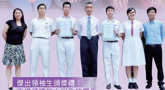
傑出領袖生頒獎禮： 表揚領導能力出色的學生

訓導組除處理日常學生的紀律事宜外，更為學校督導和培訓一批精英——領袖生團隊，以協助老師維持校園秩序。為了提升領袖生之素質，本組每年多次舉辦領袖生組長訓練營和領袖生訓練營。領袖生與組導師更會定期開會檢討工作及個別領袖生之表現。