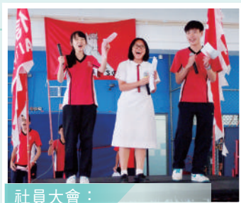
社員大會： 幹事以口號團結社員

學校每周設有全校課外活動操場集會，好讓同學推廣活動和發揮創意宣傳技巧。而於校內或校外比賽中表現優異的同學都可在講臺上獲校長頒發獎項以表揚成就。同時，課外活動操場集會的所有宣傳及頒獎皆以英語或普通話進行，使學生多講多聽及多接觸不同語言，從而增強自信心，效果十分顯著。最後，為了「追求卓越、榮神益人」，學校設有「校外活動龍虎榜」，榜上張貼了校外獲獎的同學名單及與校長的合照。