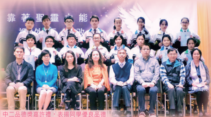
中二品德獎嘉許禮，表揚同學優良品德