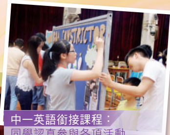
中一英語銜接課程： 同學認真參與各項活動