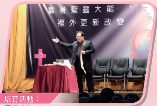
培育活動： 魔術表演