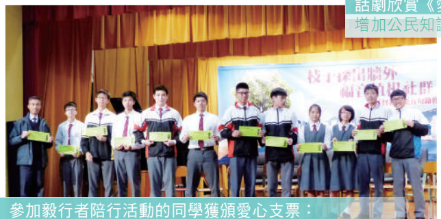
參加毅行者陪行活動的同學獲頒愛心支票： 嘉許其堅毅精神