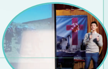
舊生分享「極地毅行」： 鼓勵同學勇於接受挑戰