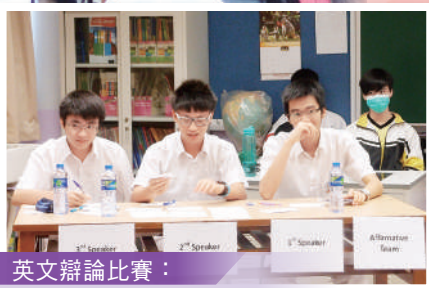
英文辯論比賽： 同學認真預備講稿