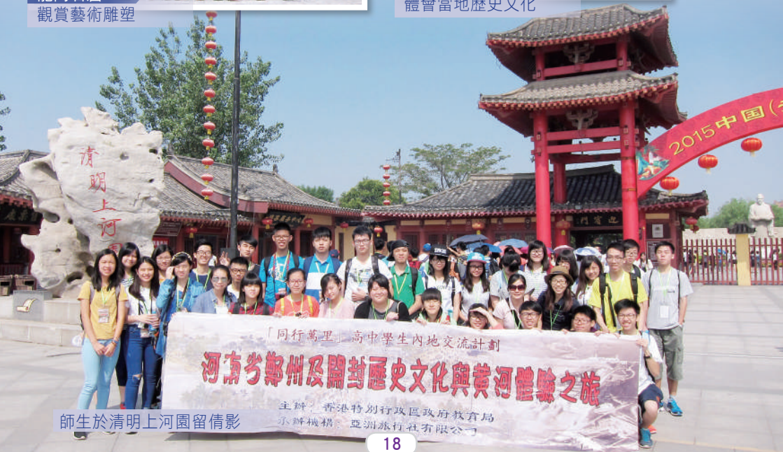
師生於清明上河園留倩影