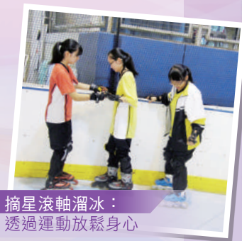
摘星滾軸溜冰： 透過運動放鬆身心