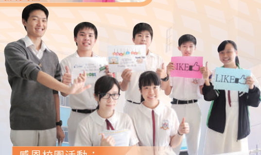
感恩校園活動： 讓同學懂得表達感恩