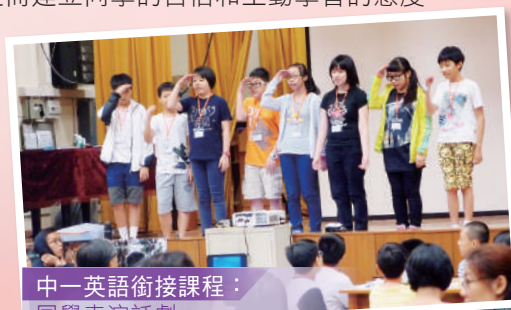
中一英語銜接課程： 同學表演話劇

今年本校將繼續訓練一群中三至中六閱讀大使，藉以推動同儕伴讀，增加全校閱讀氣氛。此外，本年中一英語銜接課程以「探索熱帶雨林」為主題，讓同學活用英語，積極參與各項富挑戰性的聽、講、讀、寫活動，從而建立同學的自信和主動學習的態度。