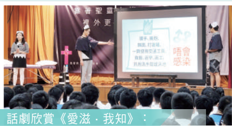
話劇欣賞《愛滋·我知》： 增加公民知識