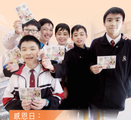
感恩日： 表達感恩的心