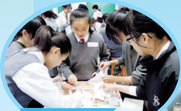
科學周活動： 製作牛奶膠