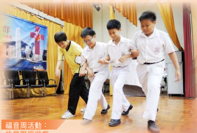
福音周活動： 快樂聯盟遊戲