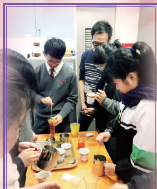
織夢·「職」動生涯規劃課程 —— 職業「體」真D