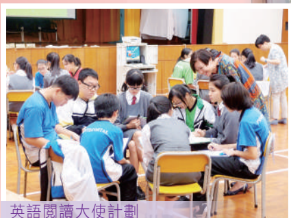
英語閱讀大使計劃