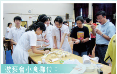
遊藝會小食攤位： 品嚐同學手製美食