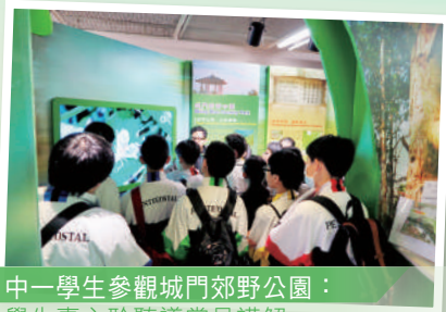
中一學生參觀城門郊野公園： 學生專心聆聽導賞員講解

本校設立全方位學習日，活動目的是將學習轉移到課室以外的地方，讓學生從實際體驗中學習。透過參觀不同的地方，令學生擴闊眼界，增廣見聞，並以探究形式去學習書本以外的知識。