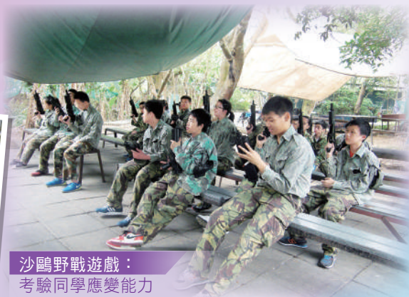
沙鷗野戰遊戲： 考驗同學應變能力