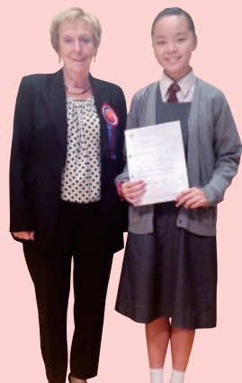
同學於學界初級組 英詩獨誦比賽獲獎