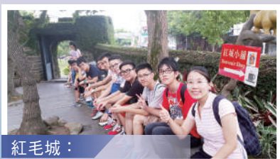
紅毛城： 體會當地歷史文化