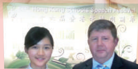
同學於學界高級組 英詩獨誦比賽獲獎