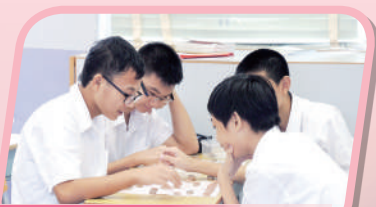
棋藝活動： 促進同學之間的友誼