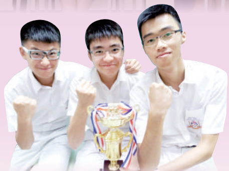
英文辯論隊於區際辯論比賽中獲得冠軍