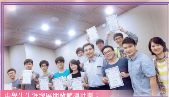
中學生生涯發展朋輩輔導計劃： 協助同學規劃未來

為提升高中同學對大學聯招及畢業後多元出路的認識，本組特意邀請學友社舉辦家長晚會，又邀請畢業生回校分享學習及工作心得。同時，本組透過「生涯規劃」課程，刺激同學思考如何規劃前路。