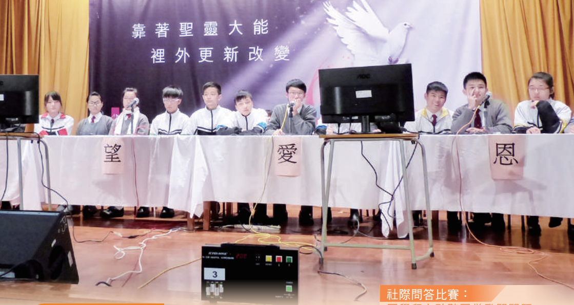
社際問答比賽： 同學留心聆聽司儀發問問題