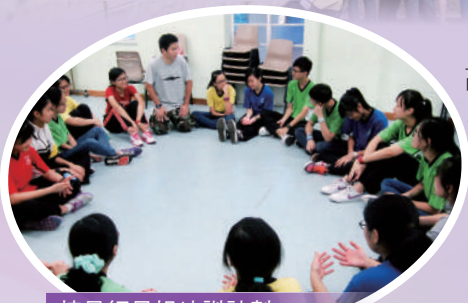
摘星師兄姐培訓計劃： 輔導同學努力向前

亦安排學生參加社區活動，以擴闊視野。本組更安排生命導師照顧個別有特殊需要的學生，幫助他們健康成長。