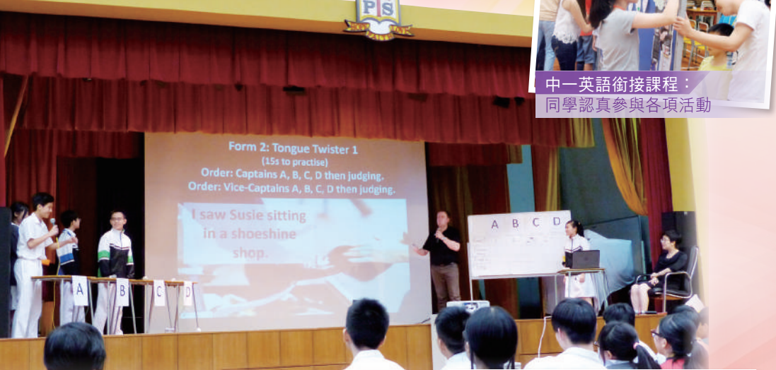
同學積極參與英文周活動