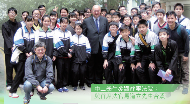
中二學生參觀終審法院： 與首席法官馬道立先生合照